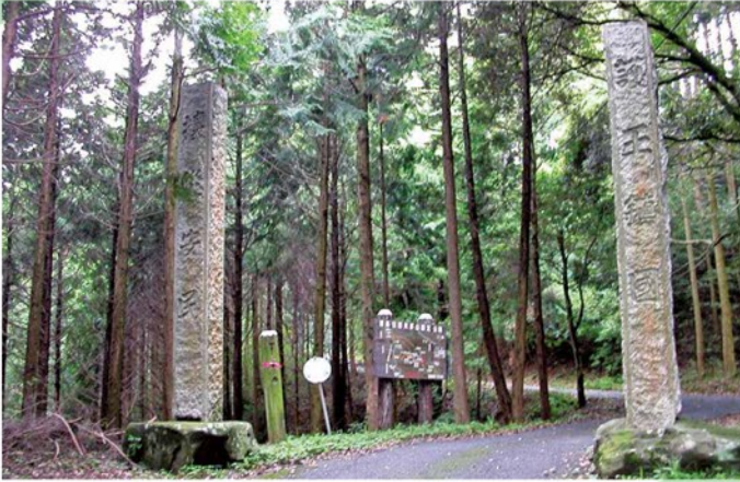
かまい せきもん 構の石門

ここにはかつて、木で作られた黒い門がたっていました。この門をくぐると、そのむこうは山伏たちの集落です。